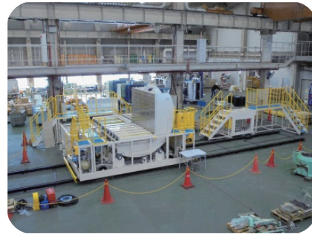
反転機能付運搬台車 最大積載重量 15t