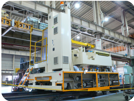
軌条走行式運搬台車 最大積載重量 30t