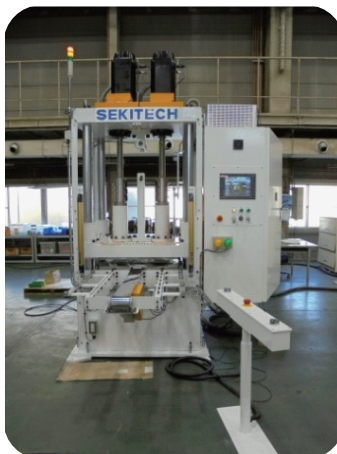
単軸電動サーボプレス機 出力 30t