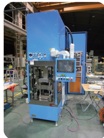
2軸電動サーボプレス機 出力 20t