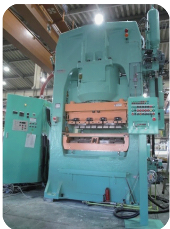
粉体成形用プレス機 出力 600t