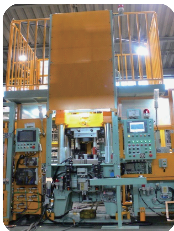
金属塑性成形用複動プレス機 出力 100t