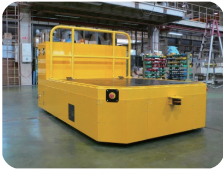
床上走行バッテリー式運搬台車 最大積載重量 10t

小ロット・多品目の生産ラインなどに設置される金型交換システムを開発。 生産形態、金型形状にあわせて最適なシステムをご提案致します。