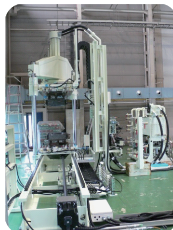
縦型樹脂成形用プレス機 出力 40t